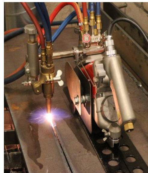
Taglio lineare con binario IK-93

L'indicatore d'angolo sul supporto cannello garantisce tagli a smusso accurati. Con l'ausilio degli accessori opzionali, un'ampia varietà di tagli può essere ottenuta con IK-93T Hawk .