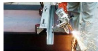
Rail de guidage droit 500 mm