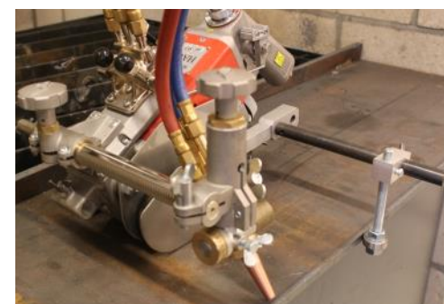
Opción de rodillo guía borde de la placa