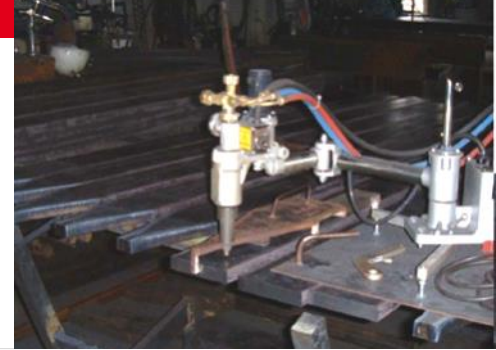
IK-82 M300 se utiliza para el corte de perfil

La IK-82 Series es una máquina ideal para mejorar la productividad y la calidad de corte de forma repetitiva. Mediante el uso de la plantilla, ranura, vieira y corte de agujeros son fáciles de hacer en perfiles de acero y refuerzos utilizados en la construcción naval.