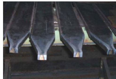
Augmente la productivité des coupes répétitives