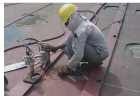
Exemple d'application sur le chantier naval