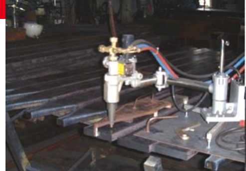
IK-82 M300 utilisée pour la coupe de profilé