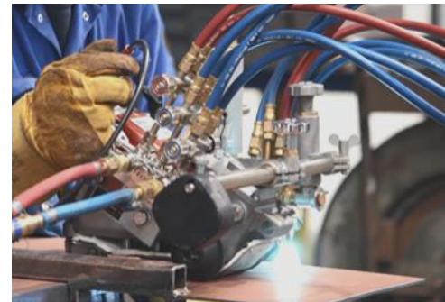
Activation/Désactivation du gaz à un seul effet