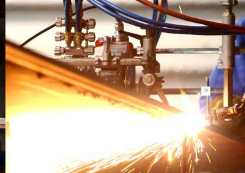
Chanfreinage (1:4 rotation d'angle) à l'aide d'un seul chalumeau