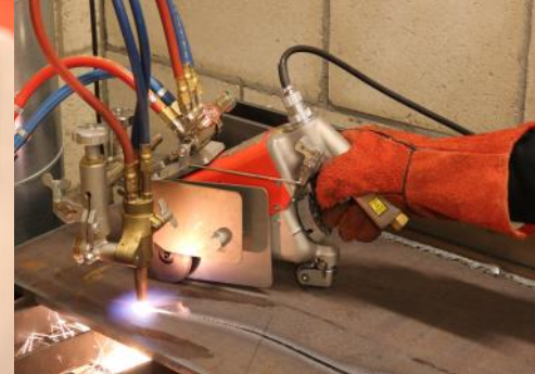
Hand snijden zonder rail