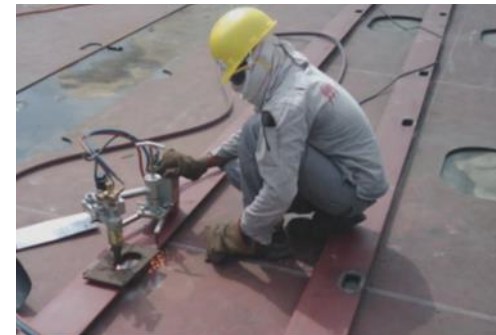
Einsatzbeispiel auf einer Werft