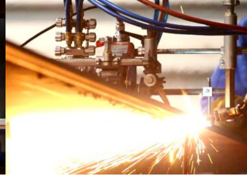
Afkanten (verhouding 1:4 bevellen) enkele toorts