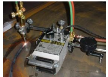
Accesorios corte circular